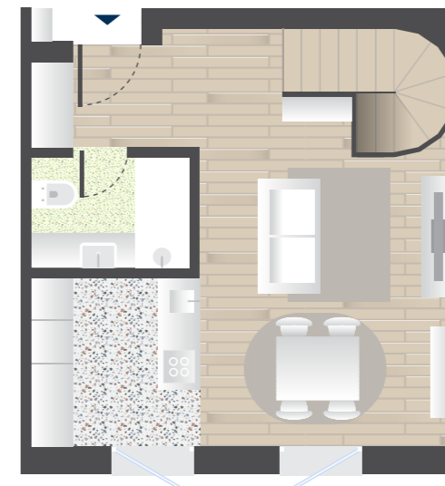
PISO 2 FLOOR 2